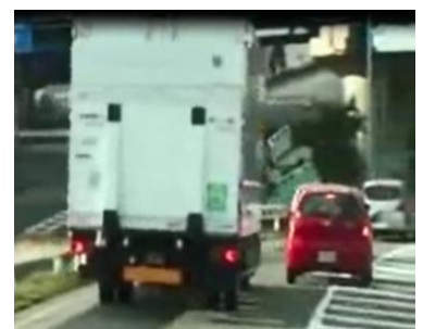
トラックの前に強引に割り込む軽自動車

※2 日本アンガーマネジメント協会 2019年5月28日発表「あおり運転と怒りの関係性」調査結果 https://www.angermanagement.co.jp/press_release/pr20190528 (2021.11.11閲覧)