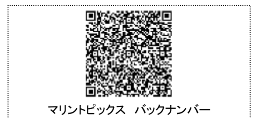
マリントピックス バックナンバー

本 Topics に関するお問い合わせ、ご意見、ご感想等ございましたら、弊社営業担当までお寄せください。編集にあたっては万全の注意を行っていますが、本 Topics 情報の正確性を保証するものではなく、これにより生じたいかなる損害に対して弊社は一切の責任を負わないものとします。